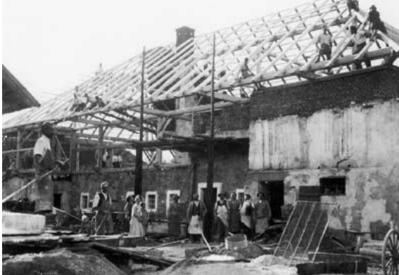
Damals: Wiederaufbau (18. 8. 1935)

Dieses Gebäude wurde erstmals im 13. Jh. 1299 erwähnt, das Bauernhaus genannt „Bamminger-Gut“ ist dann 1935 bis zu den Grundmauern niedergebrannt.